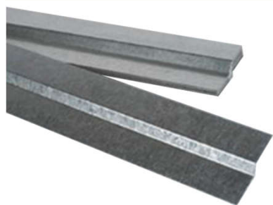
Perfil Metálico Láminas