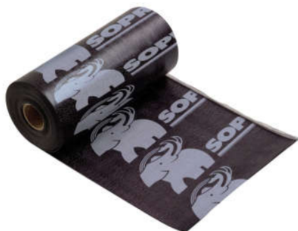
MORTERPLAS SBS FP 3 KG BAND 33