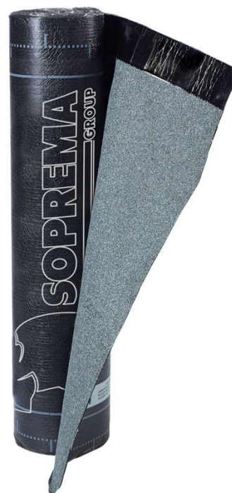
MORTERPLAS FPV MIN